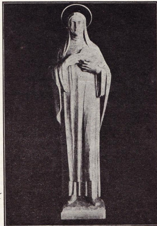
Sainte Julienne de Cornillon (Statue en chêne).

— s'il l'est jamais — que lorsque des générations de moines se seront, l'une après l'autre, couchées